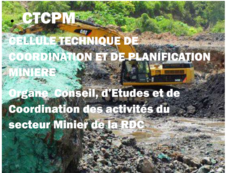
CTCPM CELLULE TECHNIQUE DE COORDINATION ET DE PLANIFICATION MINIERE

Organe Conseil, d'Etudes et de Coordination des activités du secteur Minier de la RDC