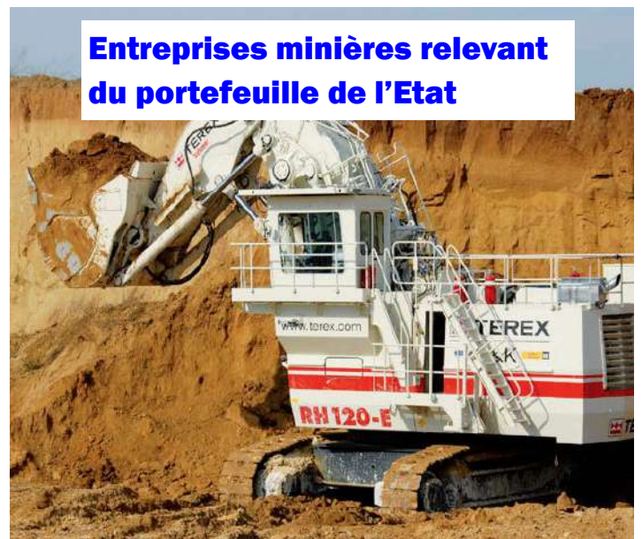
Entreprises minières relevant du portefeuille de l'Etat