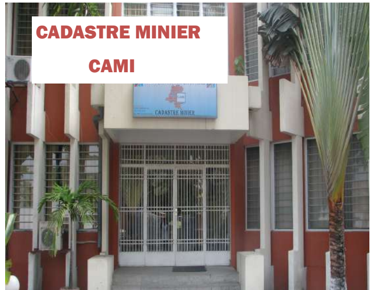
CADASTRE MINIER CAMI