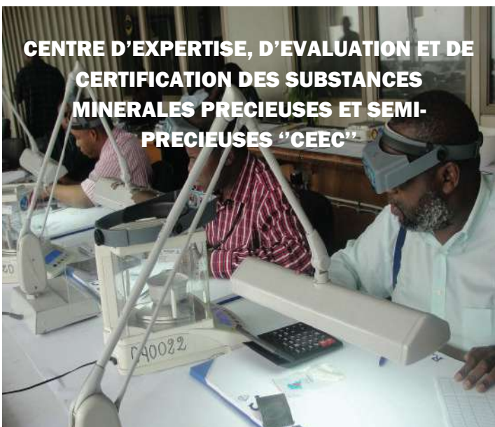
CENTRE D'EXPERTISE, D'EVALUATION ET DE CERTIFICATION DES SUBSTANCES MINERALES PRECIEUSES ET SEMI-PRECIEUSES "CEEC"