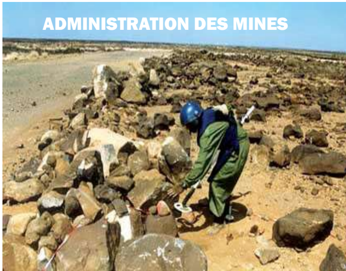
ADMINISTRATION DES MINES