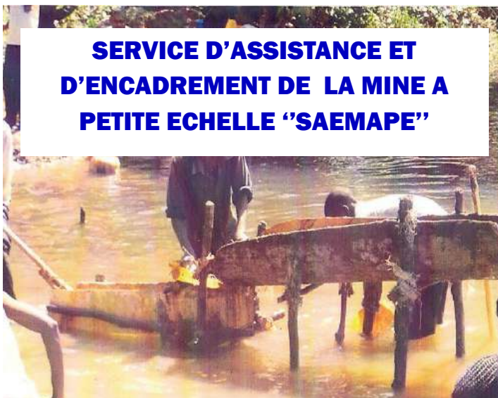
SERVICE D'ASSISTANCE ET D'ENCADREMENT DE LA MINE A PETITE ECHELLE "SAEMAPE"

Organe Conseil, d'Etudes et de Coordination des activités du secteur Minier de la RDC