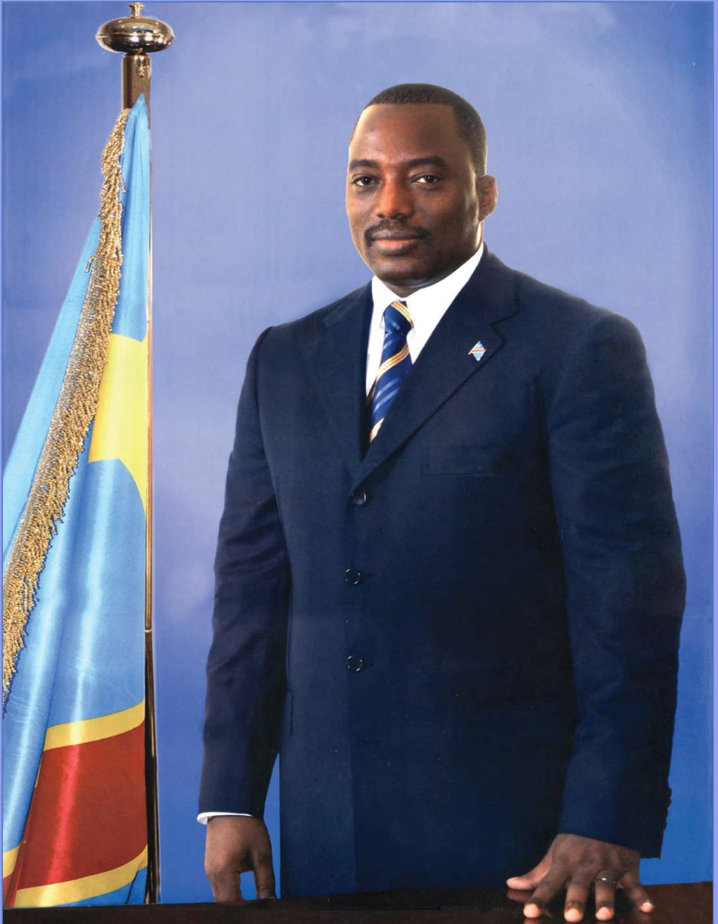
Son Excellence Monsieur Joseph KABILA KABANGE

Président de la République Démocratique du Congo